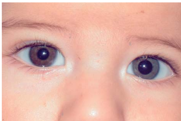
Fig. 4: Tras colirio de apraclonidina al 1% se invierte la anisocoria y disminuye la ptosis.