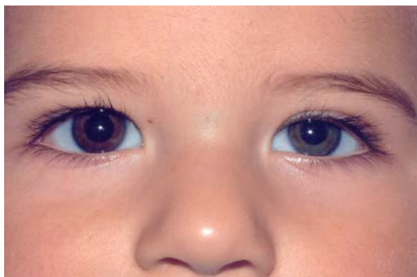
Fig. 3: Síndrome de Horner izquierdo de larga evolución: Ptosis, miosis e hipocromía de iris.

Controles neurológicos normales hasta la fecha.